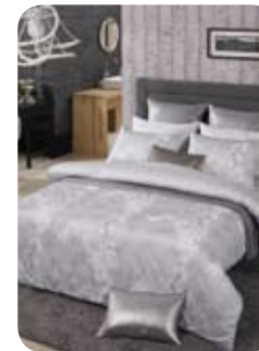
고상하고 우아한 디자인을 원한다면 ‘웨버’

올해는 운달과 겹치면서 결혼이 하반기에 집중되고 있다. 혼수 준비에 바쁜 예비 신혼 부부를 위해 아름답고 건강한 침실 문화를 선도하는 국내 1위 침구 회사 이브자리가 2012가을겨울 혼수 대표 제품 5종을 추천한다.