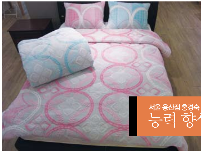
서울 용산점 흥경숙 코디네이터가 제안했다 능력 향상, 상품 Matching Card

'이달에는 어떤 상품이 잘 팔릴까?' 대리점 사장님이라면 한번 정도는 해봤을 생각을 52주 CnP에서도 하게 되었습니다. 사전 기획 단계에서부터 대리점 사장님들을 초청하여 52주 추천 상품을 선정하고, 그렇게 선정된 상품을 매장 내 VP zone(우측 이미지 참조)과 이브자리 홈페이지 내 52주 상품 게시판을 이용하여 소비자들에게 알리게 되었습니다. 그리고 대리점 사장님들의 판매 스킬을 높일 수 있는 상품 매칭 카드(아래 참조)를 제작하여 소비자 판매와 이해에 보탬이 되고자 합니다. 대리점 사장님들께서는 이제부터 52주 상품을 꼭 준비하셔서 대리점 매출을 쑥쑥 올려보는 건 어떨까요.