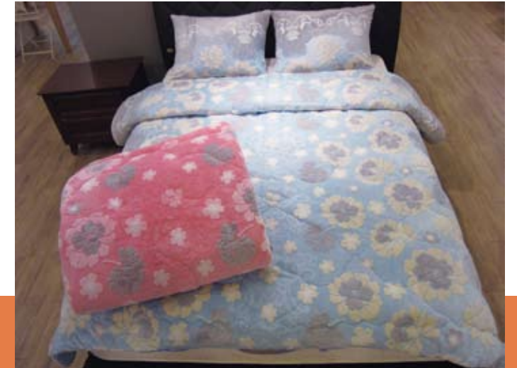
빌라주 3점 세트