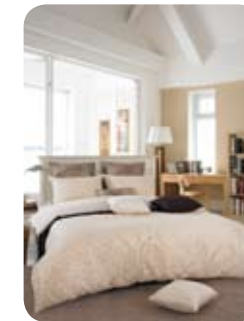
모던한 인테리어에 도회적 디자인을 원한다면 ‘더 타임’

소프트한 핑크 컬러의 도트 패턴이 로맨틱하고 귀여운 느낌을 주는 제품 ‘허니’는 사랑스러운 침실 연출에 적합하다. 하단에는 스와로브스키 스톤으로 절제된 가운데 고급스러움을 가미했다. 신혼의 달콤함과 고품격이 공존하는 ‘허니’는 러브러브한 달살 커플에게 인기가 예상된다.