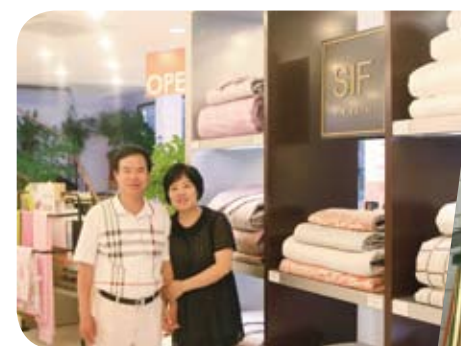
기사 제공 | 마케팅실 강혁모

서비스 또한 ‘항상 YES 하는 마음’으로 고객의 입장에서 생각하며, 더 좋은 서비스로 더 좋은 경험을 제공해 드리는데 소홀하지 않기 위해 노력했다. 그 결과 재방문과 입소문으로 단골 고객 확보, 새로운 고객의 창출에 좋은 사례가 되고 있다. 이제 진천점을 성공 점포로 만들겠다는 목표를 세운 사장님. 분면 그 목표를 향해 최선을 다해 나아갈 수 있을 거라 믿으며, 그의 도전에 박수를 보낸다.