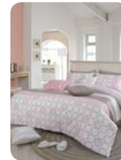
작은 평수에 안성맞춤인 ‘온 스타일’

‘코르넬’은 어울리지 않을 것 같은 레오파드 패턴과 퍼플 컬러가 조화를 이루는 믹스앤매치 디자인이다. 침구류에서는 최고급 사양에 속하는 70수 수피마 면으로 제작, 부드러운 촉감과 광택감이 뛰어나다. 총진물도 우주복 소재인 아웃라스트를 사용, 이불 속의 적정 온도를 유지시켜줘 쾌적한 수면이 가능하도록 기능성을 높였다. 디자인과 제품력을 동시에 높인 고급 제품에 속한다.