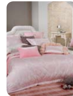
달달한 침실 분위기를 원한다면 ‘허니’

식물 모티브에 스와로브스키 스폰으로 포인트를 더한 실버 컬러 제품인 ‘웨버’는 고급스러움이 돋보이는 제품이다. 내추럴하면서도 모던한 느낌 때문에 고상하고 우아한 분위기를 선호하는 신혼 부부에게 알맞다. 소재 또한 너도밤나무에서 추출한 100% 천연 소재인 마이크로 모달과 최고급 콤팩트 면으로 제작, 고급스러움을 극대화한 친환경 제품이다.