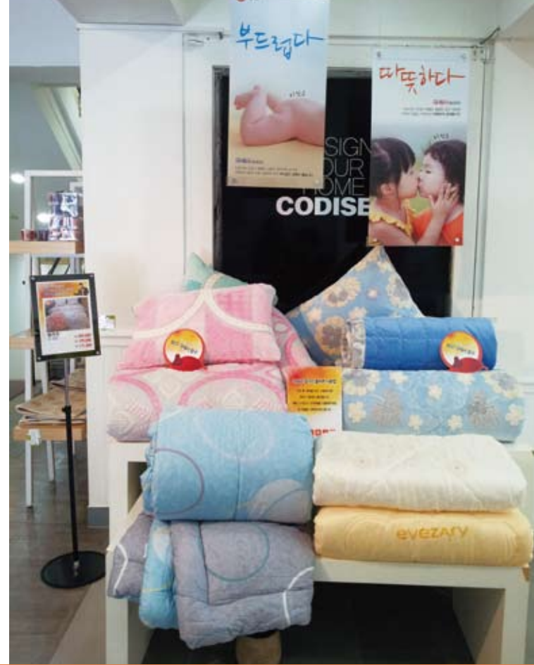
10월 VP zone 연출 사진