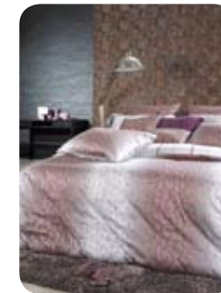
디자인과 기능 모두 최고급을 원한다면 ‘코르넬’

‘더 타임’은 2012 이브자리 F/W 품평회에서 H+ 상품으로 선정된 디자인이다. 베이지 톤의 편안함과 자유롭게 교차한 선들의 입체적인 조직감이 도시적인 느낌을 준다. ‘더 타임’은 심플하고 모던한 인테리어와 가구에 어울리는 제품으로 도회적인 취향의 신혼 부부에게 안성맞춤이다.