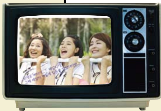
드라마 <너라서 좋아> SBS 매주 월~금 오전 8시 30분

SBS 아침 드라마 <내 인생의 단비>의 후속작으로 <너라서 좋아>가 방송을 시작했다. 이번 드라마에서는 저마다의 다른 가치관을 가진 여고 동창생이 재회하면서 서로 다른 삶의 애환과 우정을 그린다. 초반부터 7~8%의 시청률을 기록하면서 아침 시간대 시청자들의 많은 사랑을 받고 있다. 이브자리는 이 드라마를 통해 제품 홍보 및 브랜드의 인지도를 높이는데 긍정적인 효과를 기대해본다.