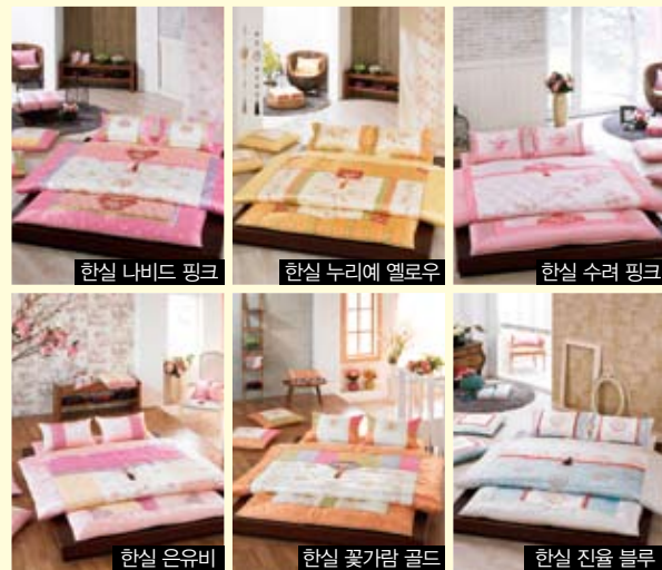
한실 나비드 핑크