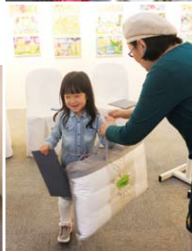
기사 제공 | 홍보팀 강혁모