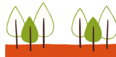
기사 제공 | 수면환경연구소 고도담

소재별 여름 이불 세트를 어떤 것으로 구입을 해야 좋을지 고민하는 고객들이 주로 여름 이불 세트는 '단면 패드 + 홉겹 이불 커버 + 베개 커버' 로 구성을 많이 한다. 여름 이불 세트는 푸른 바다 해변을 연상시키는 블루와 화이트 컬러 혹은 블루&화이트 컬러의 조합으로 제작된 것들이 많이 있다. 하지만 요즘 고객들은 블랙, 바이올렛, 그레이, 그린, 핑크 등 자신의 침실 분위기에 맞춰 고르기도 한다.