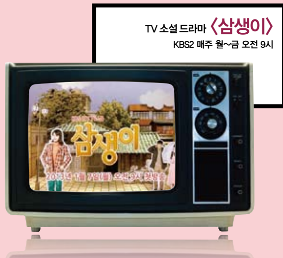
TV 소설 드라마 〈삼생이〉 KBS2 매주 월~금 오전 9시